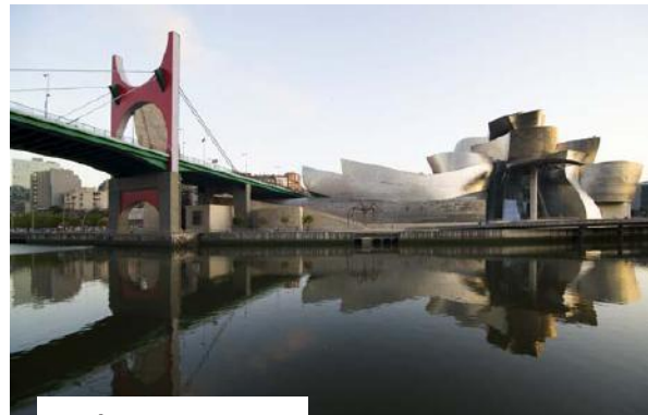
Musée Guggenheim de Bilbao

Sur le sentier du littoral faites halte à Bidart, Guéthary ou Urrugne, avant de foncer vers le Pays basque espagnol pour gravir le mont Igueldo et embrasser d'un seul regard l'effervescence de la baie de la Concha à San Sébastien. Prêlassez-vous ensuite dans l'eau bouillonnante du centre thermal La Perla. Son ambiance héritée de la Belle époque en fait un lieu hors du temps. Pour bénéficier des bienfaits de l'eau marine, le must reste de s'offrir le nouveau circuit thermal, avec bain relaxant