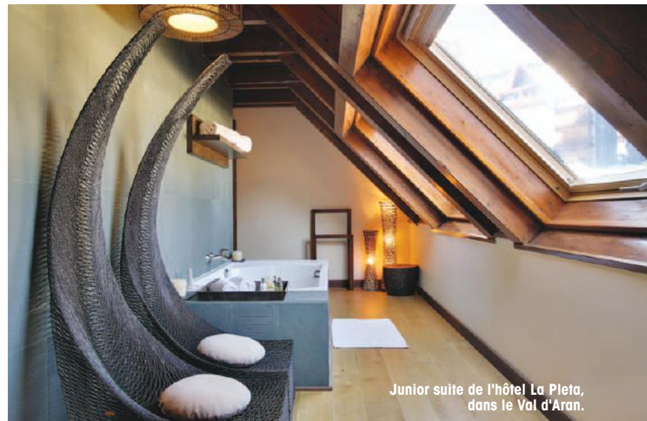
Junior suite de l'hôtel La Pleta, dans le Val d'Aran.

Pour savourer la Navidad à la catalane, direction Barcelone et le marché de Santa Llucia en quête du traditionnel Tio de Nadal, fameux morceau de bois délivrant aux enfants des petits cadeaux à partager.