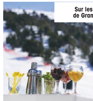
Sur les pistes de Granvalira.