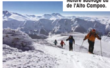
Nature sauvage au cœur de l'Alto Campoo.