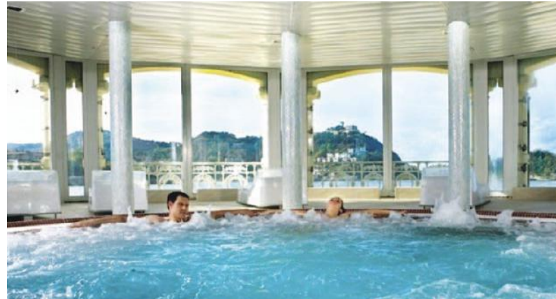
Centre Thermal La Perla, à San Sébastien.

aux extraits de pomme, massage aux algues marines et enveloppement corporel « concha de oro ».