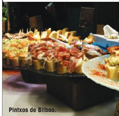
Pintxos de Bilbao.