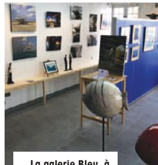
La galerie Bleu, à Saint-Jean-de-Luz.