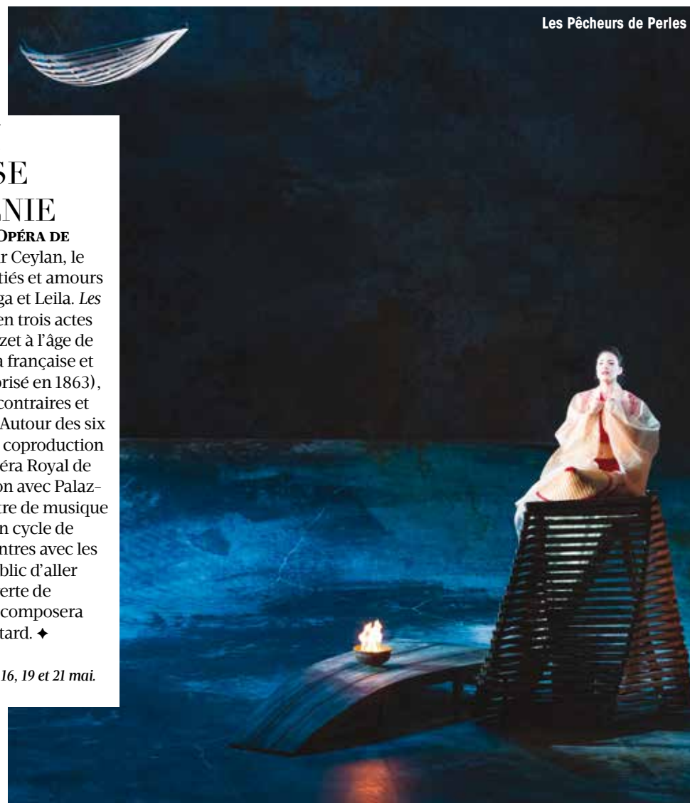
Les Pêcheurs de Perles