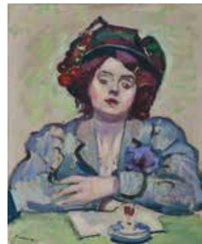
La Petite Lina de Charles Camoin