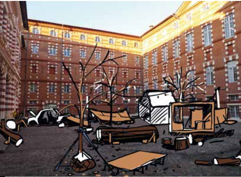
Étude préparatoire de la Radio du bout de la nuit pour le Printemps de septembre 2018.