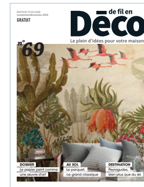
Couverture : © Tecnografica